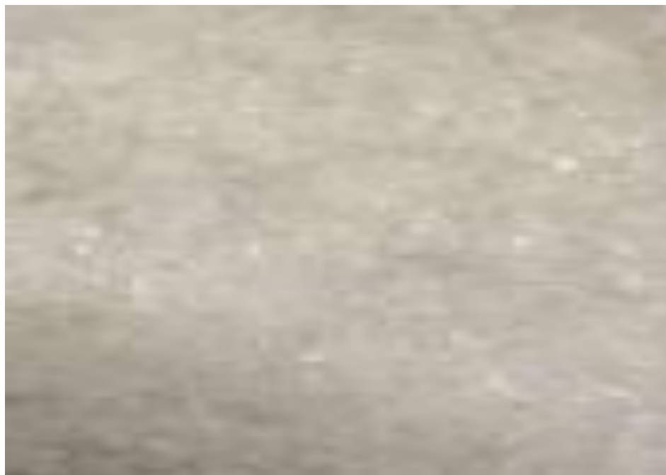
1-rasm. Tola-g‘ovakli filtr materialini

Tola-g‘ovakli filtr materialini quyidagi bikarbonat ammoniy, poliorganosiloksan, akrilli emulsiya, sopolimerlar, polipropilen va vinilxlorid asosida tayyorlangan. Ushbu filtrda polimer materiallarini qo‘llash orqali filtr materialini ishchanligini oshirish, filtr materialini qayta tozalab ishlatish va unda qo‘shimcha karkaslarni o‘rnatishdan voz kechish imkonini beradi. 1-rasmda tola-g‘ovakli filtr materialining kattalashtirilgan ko‘rinishi keltirilgan.