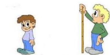
Avval nima, keyin nima? Rivojlantiruvchi loto o'yini 5-7 yosh O'yin doskasi

Sizning kichkintoyingiz "baland, novcha" va "past, pakana" so'zlar mohiyatini tushungan bo'lishi kerak.