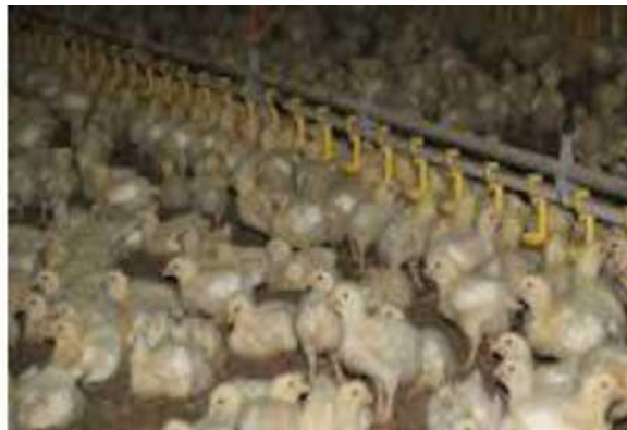
7 - 14 kunlik broyler jo'jalari

Qalin to'shamada broylerlarni etishtirish texnologiyasi eng muhim va har tomonlama mukammal o'zlashtirilgan texnologiya hisoblanadi.