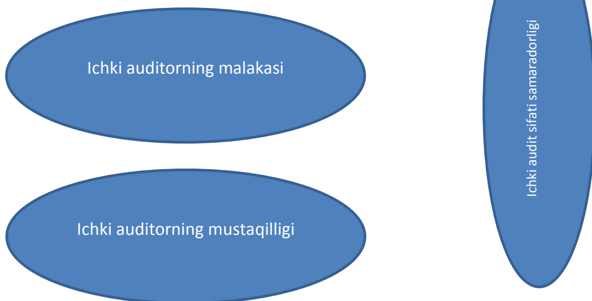
1-rasm. Ichki audit samaradorligiga ta'sir qiluvchi omillar.

Ichki audit tizimini takomillashtirishda albatta ichki auditorlarning malaka darajasi ham katta rol o'ynaydi. Shuning ichki audit xodimlarini belgilangan muddatlarda ularni malaka darajasini oshirishga e'tibor qaratish lozim. Bank operatsiyalarini amalga oshiradigan har bir xodimning malaka darajasi ham muhimdir. Chunki ichki audit xodimlari barcha operatsiyalarni tekshirish uchun imkonikatlari bulmaydi. Albatta bunda bank rahbariyatining ichki me'yorlarni samarali ishlab chiqishlari ham zarurdir. Bir suz bilan aytganda har bil omilni sinchiklab o'rganish kerak.