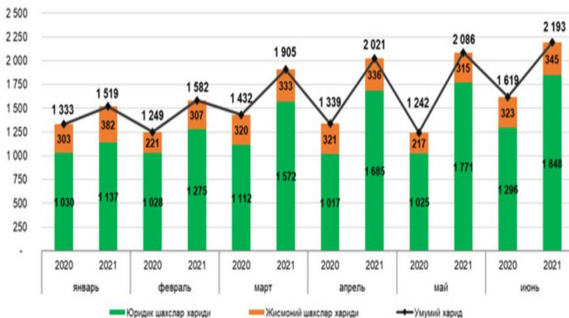
2-rasm. Ichki valyuta bozori segmentlari kesimida chet el valyutasiga bo’lgan talabning o’zgarish dinamikasi (mln dollar). 2

Tavsifi: Valyutalar tashkilotlar o’rtasida markazlashmagan tartibda, to’g’ridan-to’g’ri savdo qilinadi. Xususiyatlari: Kurslar va shartlar tomonlar o’rtasida kelishib olinadi. Yirik moliyaviy institutlar uchun mos. Misol: Katta korporatsiyalar va banklar maxsus valyuta operatsiyalari uchun OTC bozoridan foydalanadi.