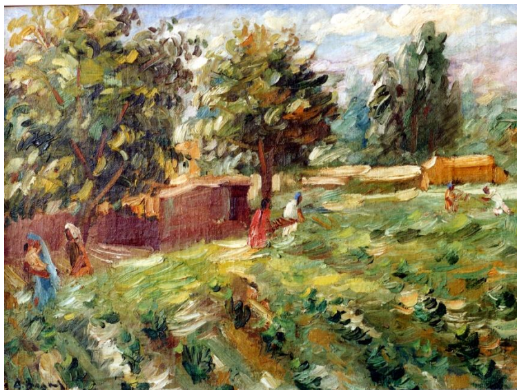
3-rasm. A.N.Volkov. Qishloq manzarasi.

Samarqandni o'rab turgan tog'larning tasvirlari, ayniqsa qishloq va shahar o'rtasidagi bog'liqlikni o'rganishda muhim rol o'ynaydi. Bu tasvirlar orqali hududning tabiiy resurslari va aholi hayotiga ta'sirini qisman tahlil qilish mumkin.