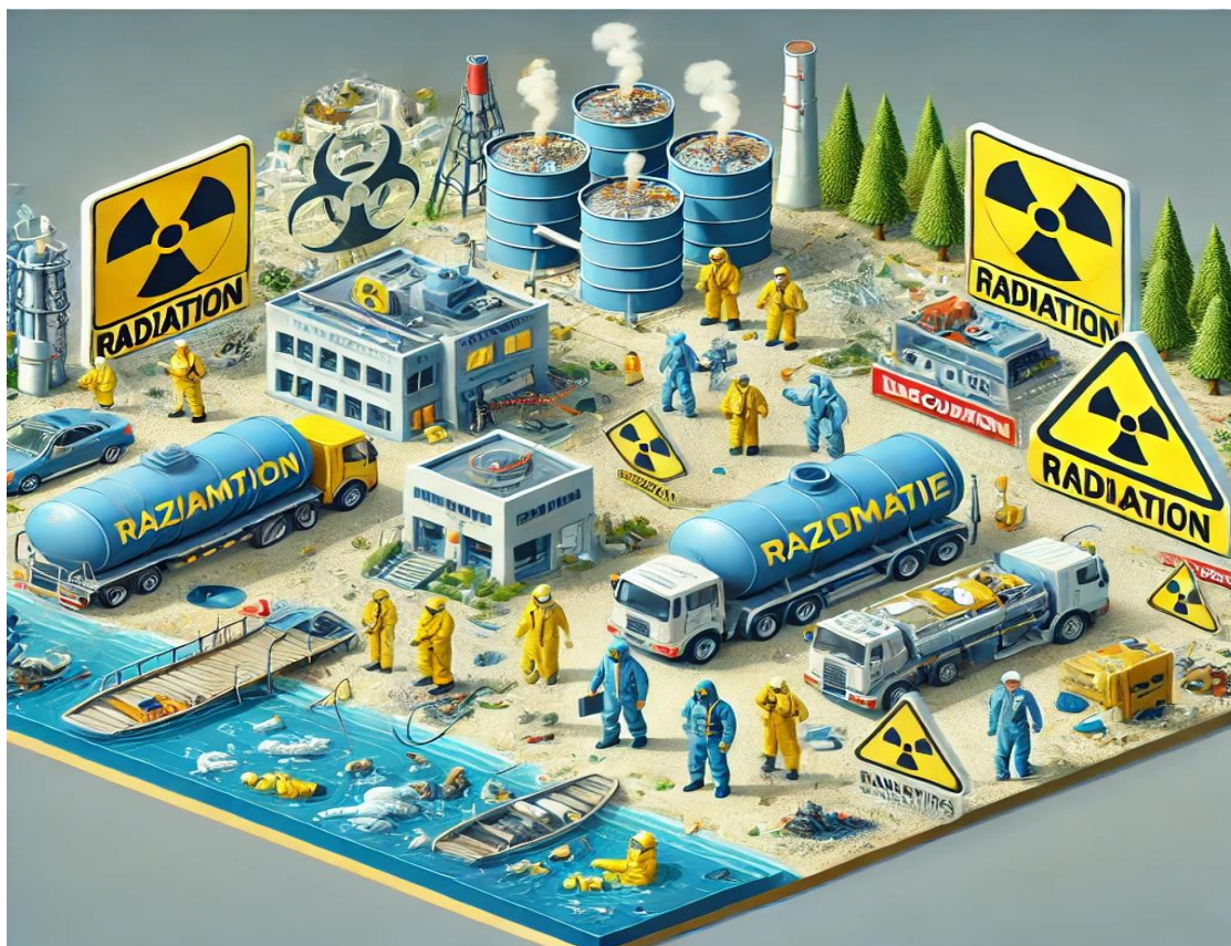
Atom Elektor Stansiyasi (AES)

• Biologik diversitetga ta'sir: Radioaktiv nurlanish ko'plab turlarni yo'q bo'lishiga olib kelishi yoki ularning yashash sharoitlarini yomonlashtirishi mumkin. Masalan, Chernobil hududida hayvonlar va o'simliklarning genetik mutatsiyalari kuzatilgan.