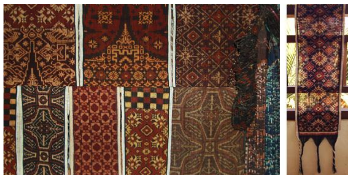
3-rasm. Double ikat. (Ikki tomonlama ikat) Bali qishlog'i, Tenganan. Indonesiya. Tasmaniya galereyasi.

Ikatning mahorati va murakkabligiga qarab, naqshning konturlari biroz xiralashgan ko'rinishi mumkin. (3-rasm).