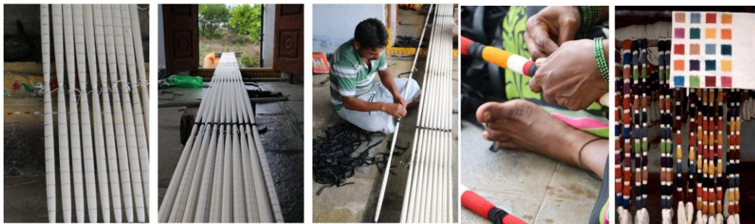
2-rasm. Ipak tolalarni rang berish uchun tayyorlov jarayoni, naqsh asosida kerakli joylarni mahkamlab bog'lash.

Bog'langandan so'ng, ochiq bo'laklar bo'yaladi, yopiq bo'laklar esa rang olmay qoladi. Bu jarayon, oddiy bitta rangli naqshlardan tortib, ko'p rangli naqshlargacha, istalgan effekt va ranglar palitrasini yaratish uchun bir necha marta bo'yash va qayta bog'lashni o'z ichiga olishi mumkin, Qo'lda tikilgan ikatlar an'anaviy dastgohlarda elektr energiyasidan foydalanmasdan to'qiladi. Ip bo'yalgandan so'ng, u to'quvchi tomonidan mohirlik bilan to'qilgan dastgohga tiziladi. Geometrik shakllar, kvadratlar, yulduzlar va xochlarni o'z ichiga olishi mumkin bo'lgan naqshning muvozanatini saqlash uchun har bir ipni ehtiyotkorlik bilan sozlash kerak.(2-rasm).