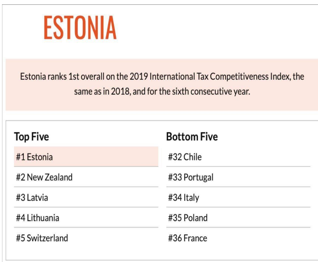
1-rasm. Estoniya soliq tizimini raqamlashtirish ko‘rsatgichlari

Masalan, 2022 yilda Estoniya soliq tizimini raqamlashtirish orqali soliq yig‘imlarini 12% ga oshirganini ko‘rish mumkin (Estonian Ministry of Finance, 2022).