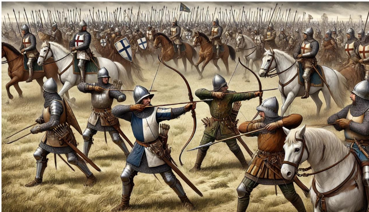
2-rasm. Azinkur jangida ingliz uzun kamonchilarining jang sahnasi.