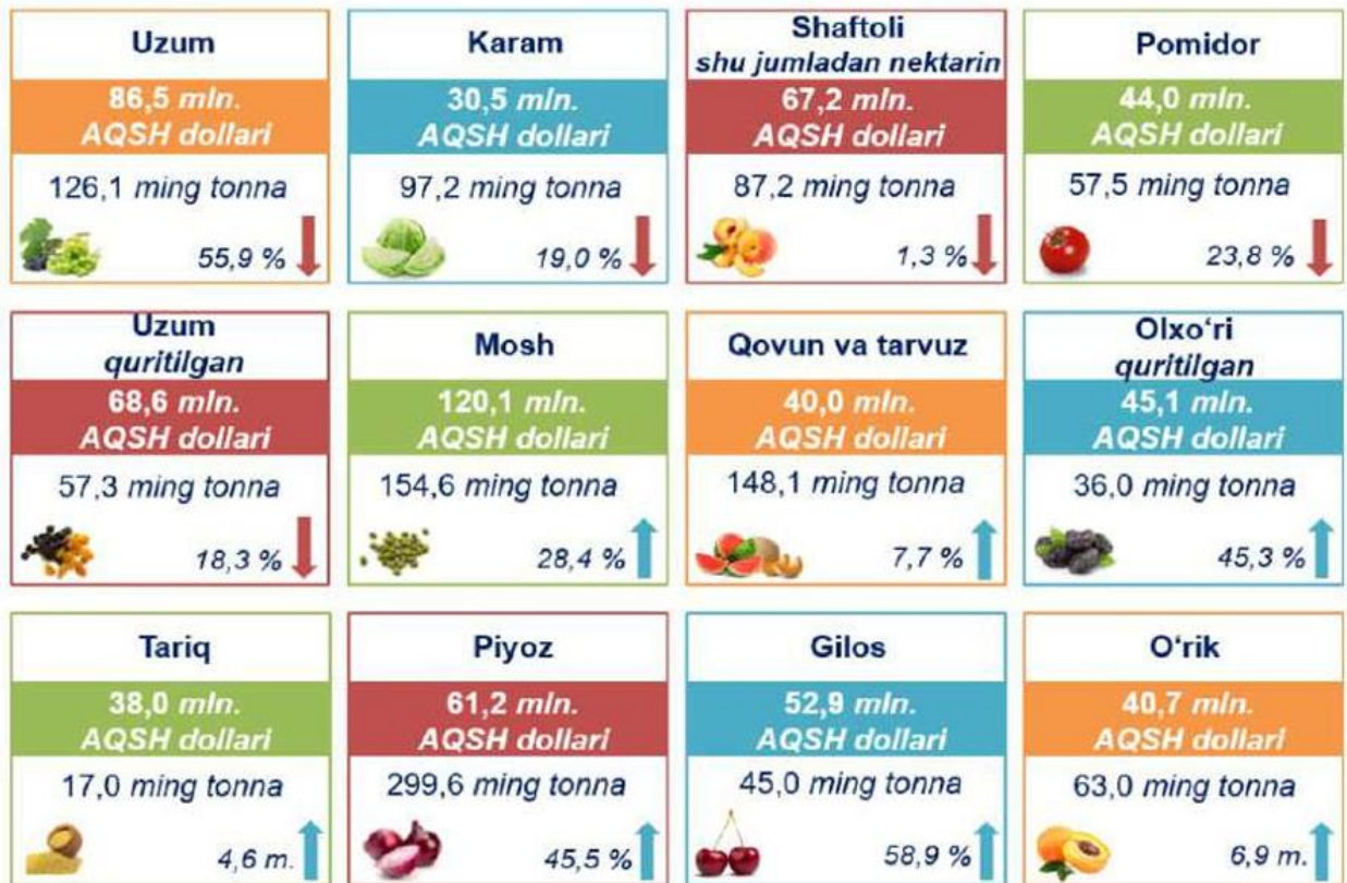
2-rasm. Meva-sabzavot mahsulotlari eksporti (2023-yil yanvar-dekabr)

Davlat tomonidan yaratilgan qulay shart-sharoitlar sababi mamlakatimizda oziq-ovqat mahsulotlarini eksport qilish hajmi ortib bormoqda jumladan, 2023 yilda mosh, qovun-tarvuz, olxo'ri, tariq, piyoz, giloz va o'rik eksporti oldingiga nisbatan sezilarli darajada ortganligini ko'rish mumkin.