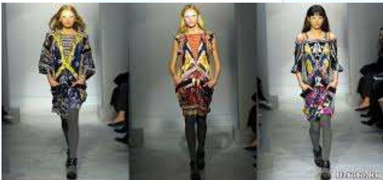
2-rasm . Chet el zamonaviy kiyimlarda o‘zimizni milliylikni aks ettirilishi

Shunday qilib, o‘quv amaliyotlarida milliy kiyimlarning zamonaviy talqini nafaqat tarixiy va madaniy qadriyatlarni saqlashni, balki iqtisodiy va ijtimoiy rivojlanishga, barqaror modaga hissa qo‘shishni ham ko‘zlaydi. Milliy kiyimlar va ularning zamonaviy dizayndagi talqini, o‘quv jarayonida talabalarni faqat estetik jihatdan emas, balki texnik, texnologik va ekologik jihatdan ham rivojlantiradi. Bunday amaliy mashg‘ulotlar orqali talabalar nafaqat milliy an‘analarni hurmat qilishni, balki global tendensiyalarni o‘zlariga xos uslubda tatbiq etishni o‘rganadilar. Zamonaviy