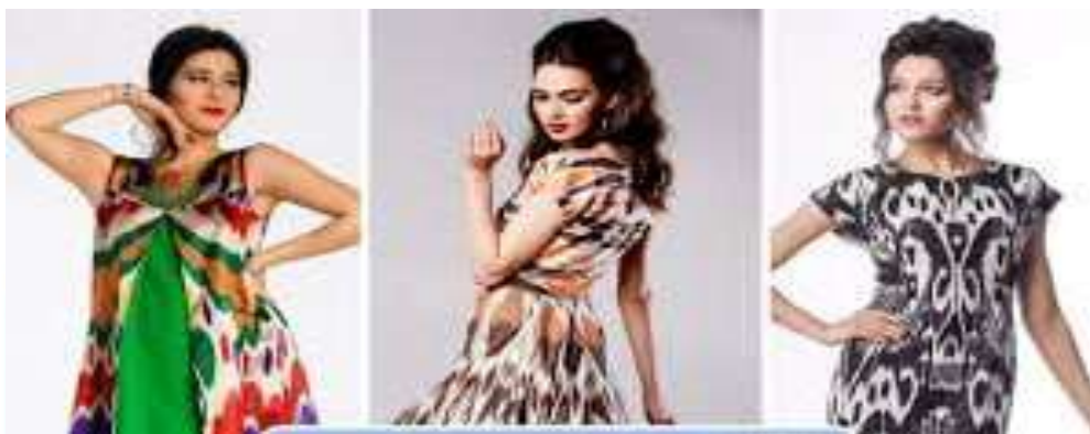
1-rasm. zamonaviy kiyimlarda milliylikni aks ettirish