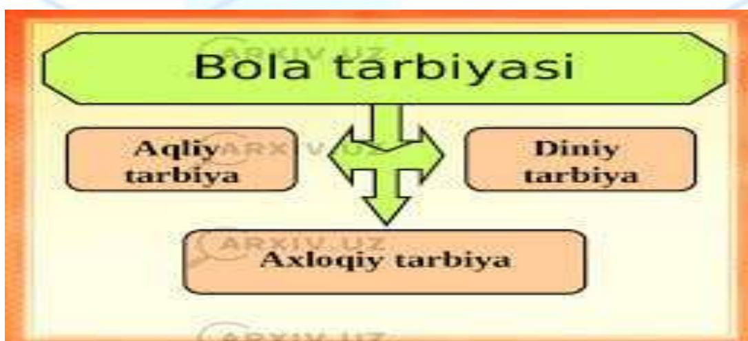
1-rasm. Bola tarbiyasi bo'g'inlari

o'quvchilarni nafaqat ishlashga, balki jamiyatdagi adolatli, mehnatsevar, halol va mas'uliyatli shaxslar sifatida shakllantirishga xizmat qiladi. Shuningdek, bu tarbiya orqali o'quvchilarda kelajakdagi ijtimoiy roli, ya'ni fuqarolik mas'uliyati, jamiyatga bo'lgan aloqalari va jamoaviy ruhini rivojlantirish mumkin. Kasb-hunar maktablarida axloqiy tarbiya tizimi o'zining maxsus metodlari, ta'lim usullarini va samarali pedagogik yondashuvlarini o'z ichiga oladi. Bular orqali o'quvchilar axloqiy qoidalarni va ma'naviy qadriyatlarni hayotda amalda qo'llashni o'rganadilar.