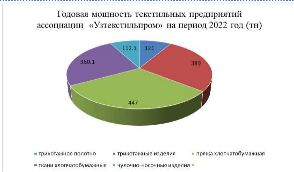
Рисунок 1. Годовая мощность текстильных предприятий ассоциации «Узтекстильпром» на период 2022 год (тн)

О роли текстильной промышленности в макроэкономическом комплексе страны позволяют судить следующие данные: на сегодняшний день она дает примерно пятую часть валового внутреннего продукта, в ней сосредоточена треть всех работников, занятых в промышленности республики. В разные годы текстильная промышленность формировала от 25 до 28 % доходной части государственного бюджета. Координация развития отраслей текстильной промышленности, привлечение инвестиций и техническое перевооружение ее ведущих предприятий, наращивание экспорта и расширение импортозамещения осуществляется Кабинетом Министров Республики Узбекистан.